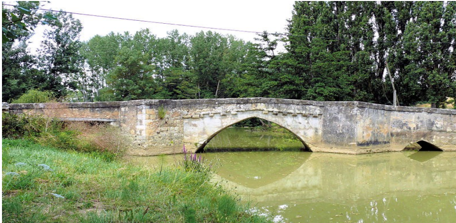
Le vieux pont de Pavie