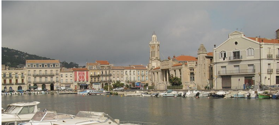
Le Canal Royal à Sète, Hérault, France.

http://creativecommons.org/licenses/by-sa/3.0/deed.en